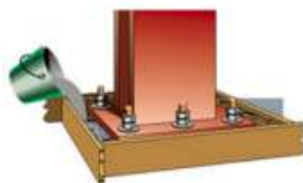
Fixação de Estruturas Metálicas