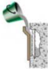
Recuperação e reforço de Estruturas