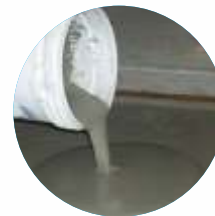
Recuperação de Pisos

Grauteamento e/ou concretagem de: fundações (sapatas; vigas baldrames), colunas de concreto, vigas de concreto, pisos de concreto, muros de concreto (inclusive arrimo), colunas de alvenaria estrutural, calçadas, equipamentos mecânicos diversos entre outros reparos, reforços e ancoragens.